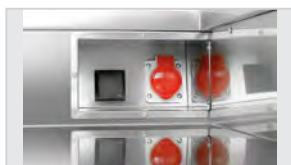
▶ 5 розеток 3 x 230 В 2 x 400 В 16 А CEE