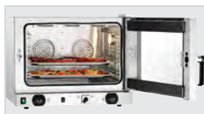
► Легке завантаження завдяки бічним петлям дверцят