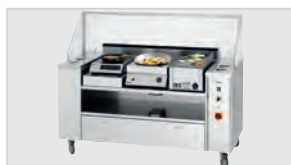
▶ Підходить для 2–3 настільних приладів

Очікуваний прихід на склад у м. Зальцкоттен 03/2024