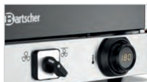
► Ручка MDI