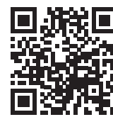
▶ szczegółowe informacje o produktach – www.bartscher.com