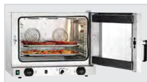
▶ łatwe wyposażenie dzięki bocznemu zawiasowi drzwi