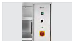
▶ zintegrowana wentylacja ▶ z filtrem labiryntowym ze stali szlachetnej ▶ 3-stopniowa regulacja