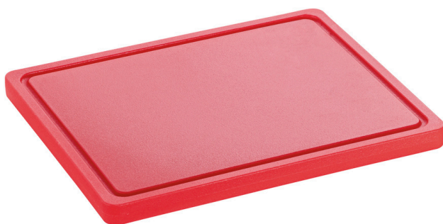
Planche à découper PRO 32x26 R-R