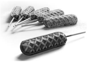
На паличці, заокруглені