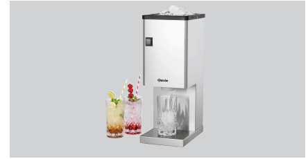
► Дробарка для льоду з викидною воронкою