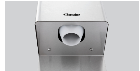
► Direktes Auffangen mit dem Glas möglich