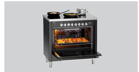
▶ Ausgelegt für: Induktionsherd 6K-EBMF