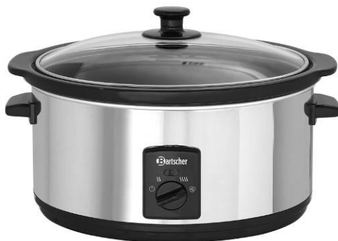
A100265 / 6,5L