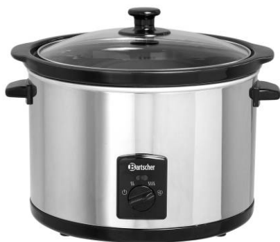
A100155 / 5,5L