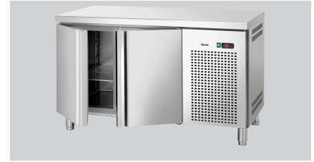
► Ausgelegt für: Tiefkühltsch T2-1341