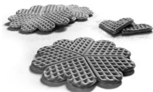
Forma de corazón