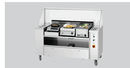
► Pour les poste de cuisson KST Eco