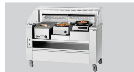
► Pour les postes de cuisson KST Plus