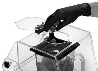
Tophul med en prop