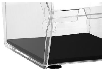
Met akoestische matten