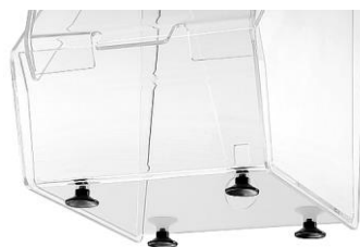
4 zuignappen voor stabiliteit