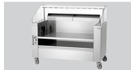
▶ Ontworpen voor het kookstation KST3240 Plus