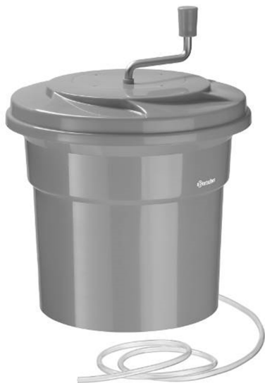
K1-25L / 120709