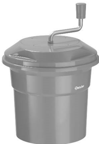
K1-12L / 120710

Оригінальна інструкція з експлуатації V1/0317