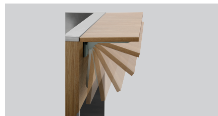
▶ С горкой для подносов