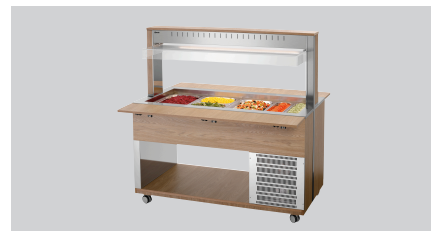
▶ Буфетная тележка для охлажденных блюд