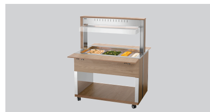
► Carro para bufé para platos calientes