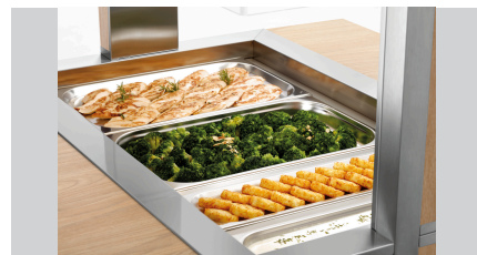
► Ontworpen voor