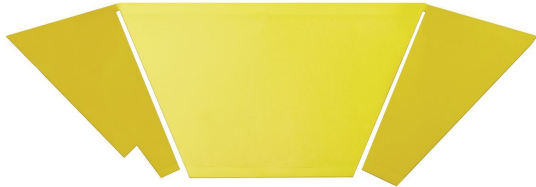
Lámina adhesiva IF-92