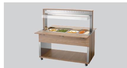
► Carro para bufé para platos calientes