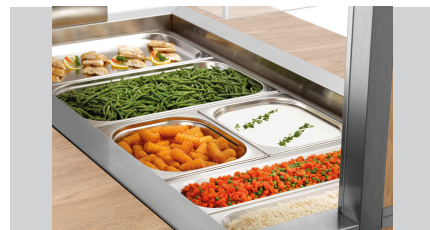
► Ontworpen voor