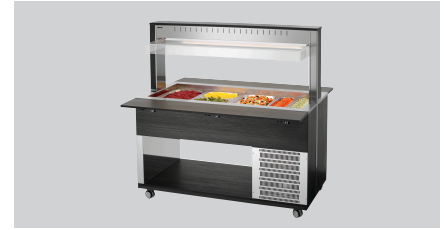
► Буфетний візок для холодних страв