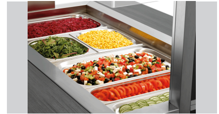
► Призначено для