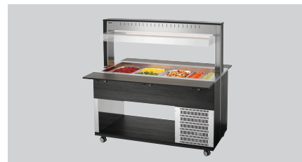
▶ Буфетная тележка для охлажденных блюд