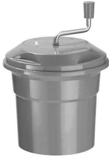
K1-12L / 120710