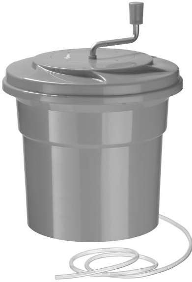
K1-25L / 120709