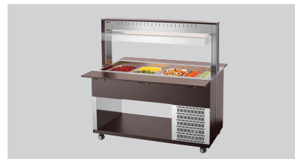
► Буфетний візок для холодних страв