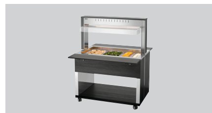
► Wózek bufetowy na ciepłe dania