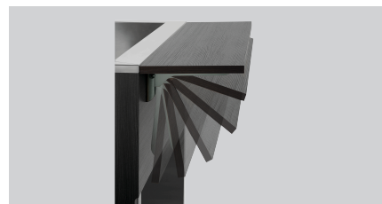
► Met dienbladslide