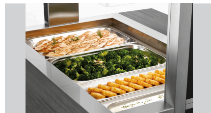
► Ontworpen voor