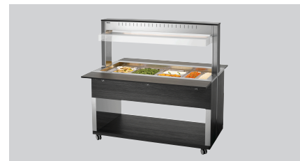
► Wózek bufetowy na ciepłe dania