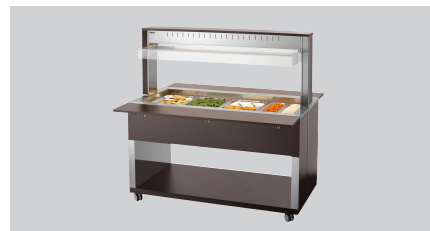
► Буфетний візок для теплих страв