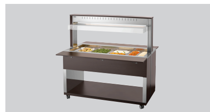
► Buffetwagen voor warme gerechten