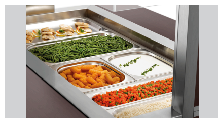
► Ontworpen voor