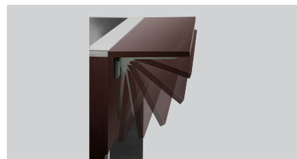
► Met dienbladslide