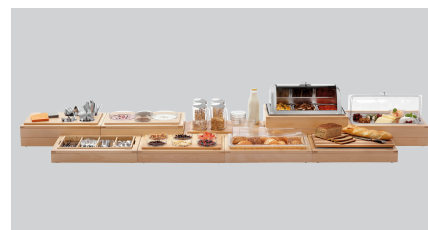
▶ Buffet-systeemset in eenvoudig houtontwerp