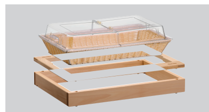
▶ Eenvoudig steeksysteem