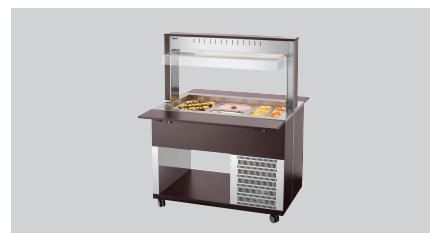
► Буфетний візок для холодних страв