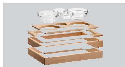
▶ Eenvoudig steeksysteem