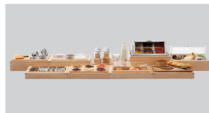
▶ Buffet-systeemset in eenvoudig houtontwerp