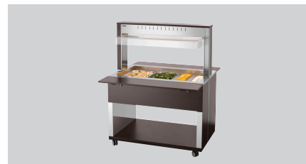
► Buffetwagen voor warme gerechten