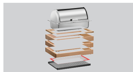
► Einfaches Stecksystem