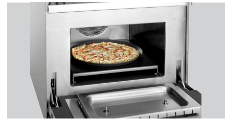
▶ Pour le Snackjet 200