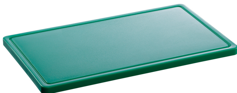
Planche à découper PRO 53x32 GR-R