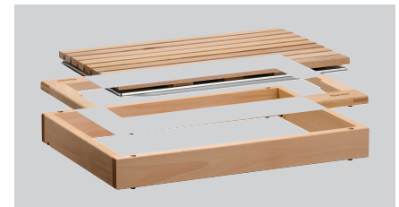
▶ Einfaches Stecksystem