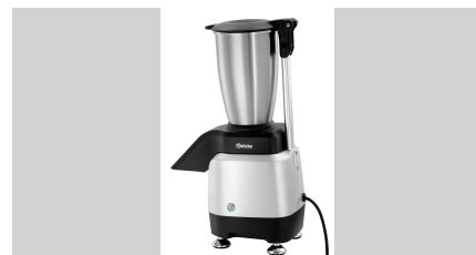
► Wysoka wydajność ✓ 120 kg / godzinę