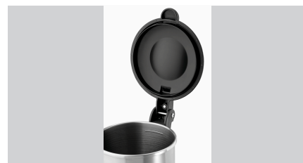
► Większe bezpieczeństwo ✓ magnetyczny przełącznik kontaktowy na pokrywie ✓ 4 nóżki antypoślizgowe