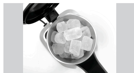
► Pojemność pojemnika na lód: ✓ 3 litry