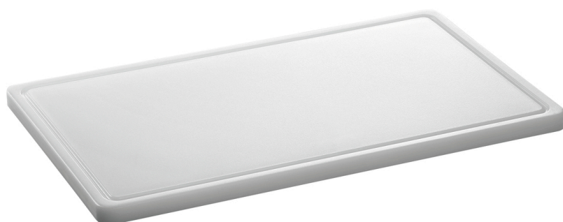
Planche à découper PRO 53x32 W-R