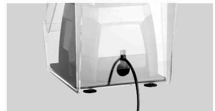
▶ Öffnung für Kabelausgang