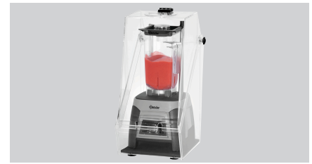
▶ Passend zum Blender PRO 2,5L