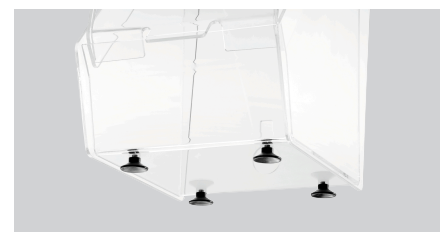
▶ Sicherer Stand ✓ 4 Saugnäpfe