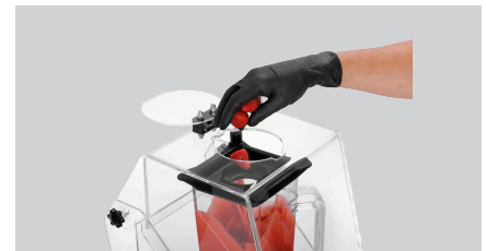
▶ Öffnung für Einfüllschacht ✓ Mit Verschlussklappe