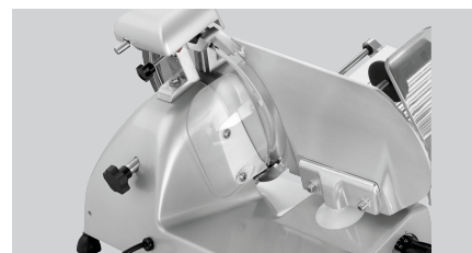
▶ Guida per affettatura precisa