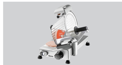
▶ Per salumi