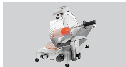
► Ausgelegt für Wurst