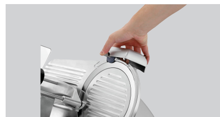
► Praktischer Messerschärfer