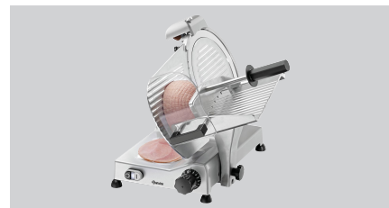
► Ausgelegt für Wurst