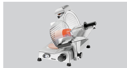
► Ausgelegt für Wurst