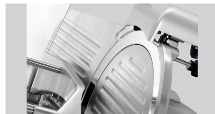
► Zweifacher Messerschutz ✓ Messerschärfer als Messerabdeckung ✓ Rückstellung des Messers