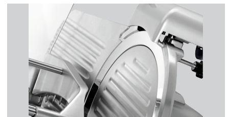
► Zweifacher Messerschutz