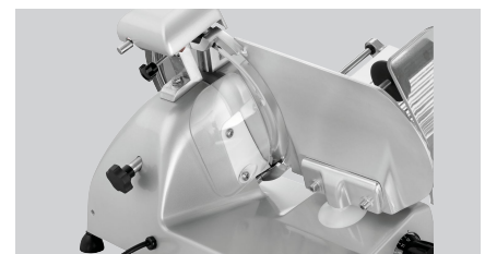
► Saubere Aufschnittführung