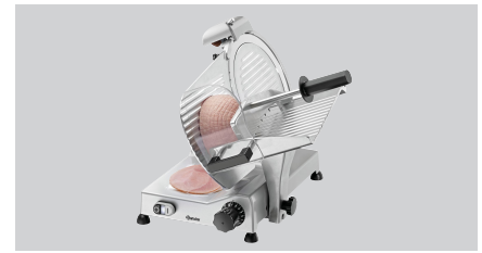
► Ausgelegt für Wurst