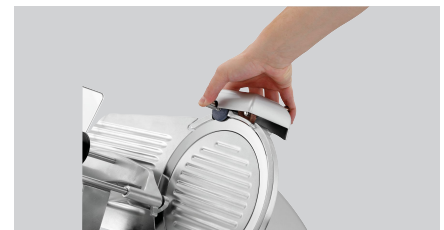
► Praktischer Messerschärfer