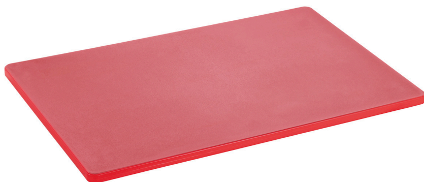
Planche à découper 60x40 R