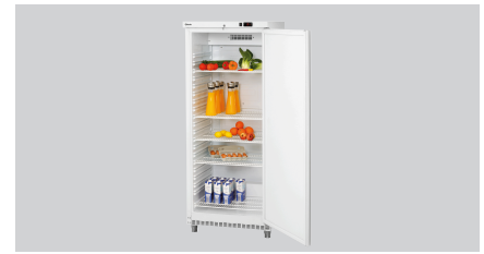
► Ausgelegt für: Kühlschrank 600 WSTL