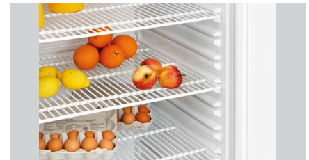
► Für den mittleren und oberen Kühlschrankbereich geeignet