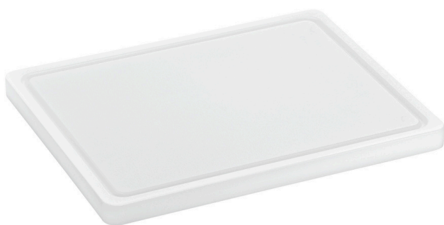
Tabla de cortar PRO 32x26 W-R