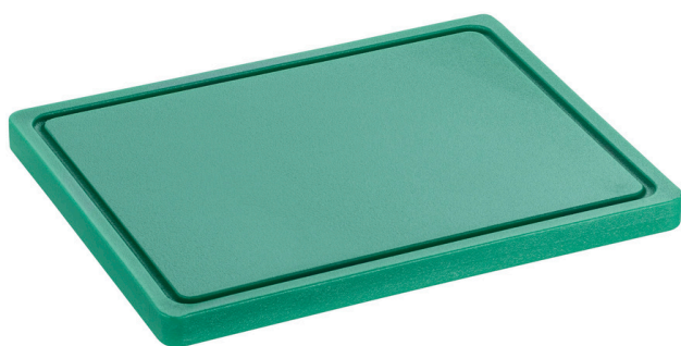
Tabla de cortar PRO 32x26 GR-R